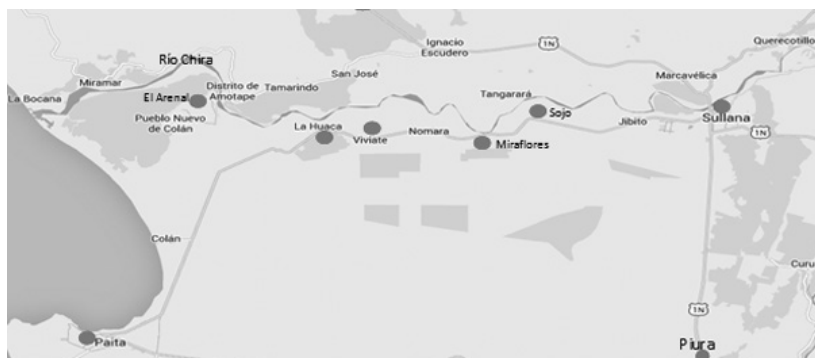
Figura 2 Estaciones de la línea ferroviaria de Paita a Piura