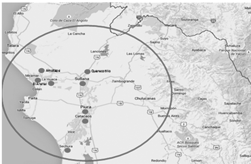
Figura 3 Zonas agrícolas de Piura

La importancia económica que Piura llegó a alcanzar para el Estado peruano —en función al incremento de sus ingresos aduaneros a través del puerto de Paita— se reflejó en el informe anual que el prefecto piurano Rodríguez Ramírez emitió en 1891 al gobierno peruano, donde anunció que: “Hace seis años que la renta viene mejorando progresivamente; y se tiene en cuenta que la exportación e importación es casi exclusivamente para el Departamento, se le puede considerar como la más productiva de la República” (Moscol, 1989: 68). De esta manera, el algodón representó un papel importante en el mundo manufacturero beneficiado por la feracidad de los valles de Piura, Catacaos, Sullana, Sechura, Amotape, Querecotillo, El Arenal y La Huaca (Pereira, 1862: 281).